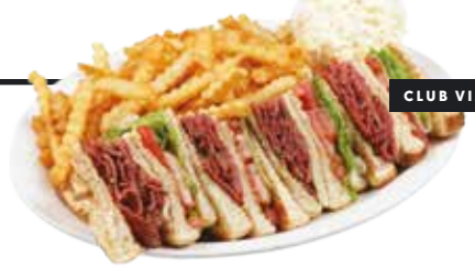
CLUB VIANDE FUMÉE