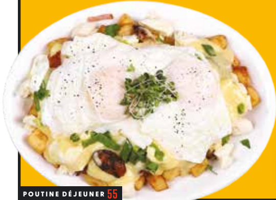
POUTINE DÉJEUNER 55