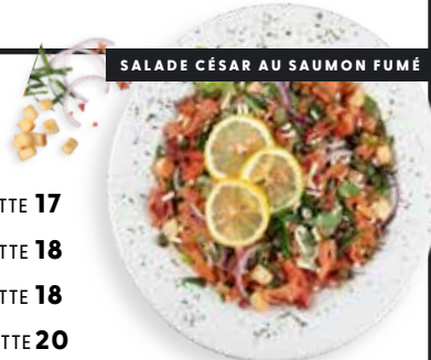
SALADE CÉSAR AU SAUMON FUMÉ