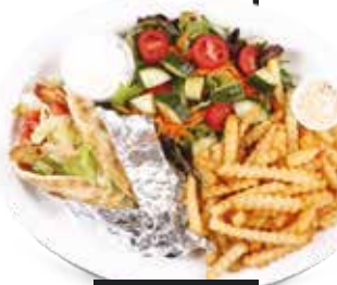
PITA AU POULET