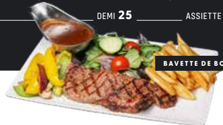
BAVETTE DE BŒUF 8 OZ