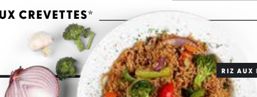
RIZ AUX LÉGUMES