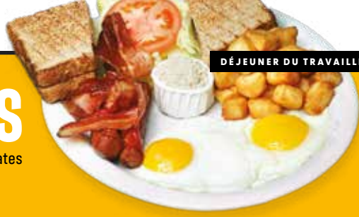
DÉJEUNER DU TRAVAILLEUR