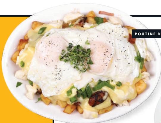
POUTINE DÉJEUNER 55