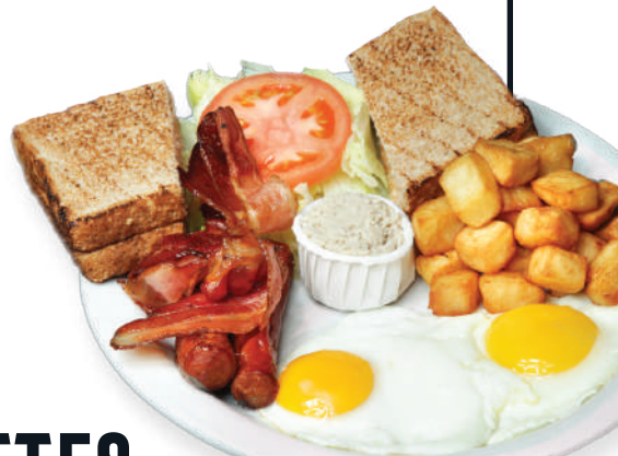
DÉJEUNER DU TRAVAILLEUR