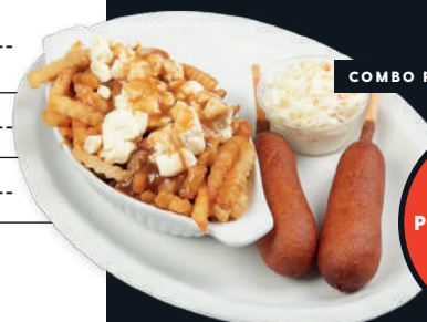
COMBO POGOS POUTINE

CHANGEZ VOS FRITES ▼ POUR DES FRITES À LA BIÈRE OU UNE POUTINE