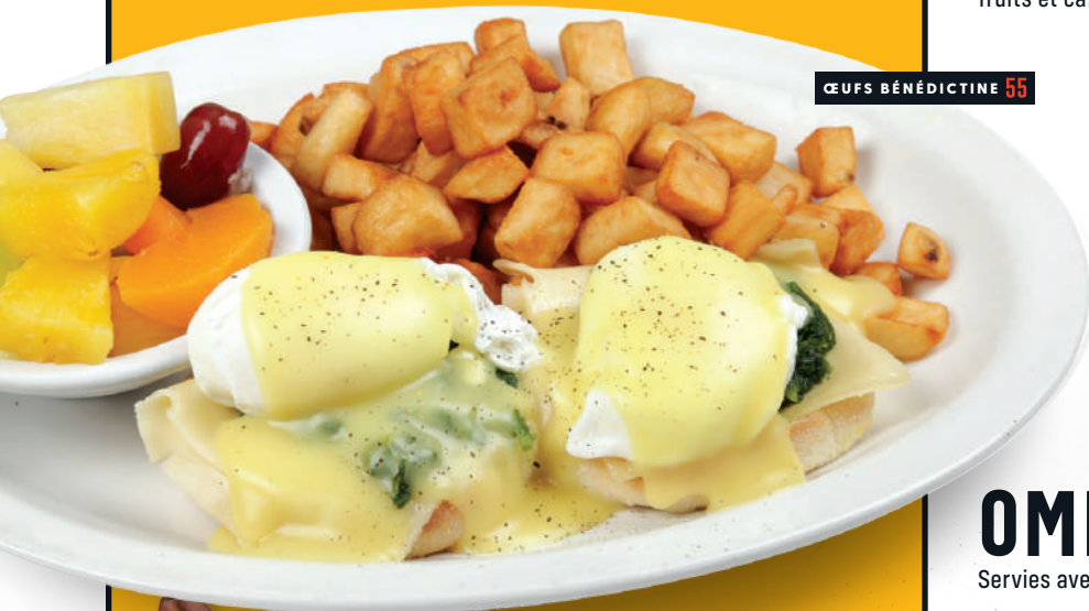
ŒUFS BÉNÉDICTINE 55

2 œufs, 2 saucisses, bacon, fèves au lard, cretons, rôties, patates, fruits et café