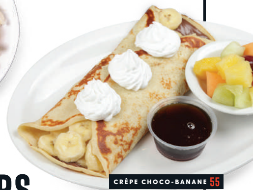
CRÊPE CHOCO-BANANE 55