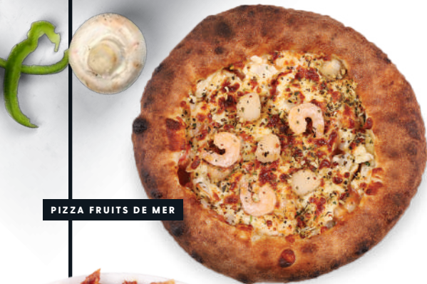
PIZZA FRUITS DE MER